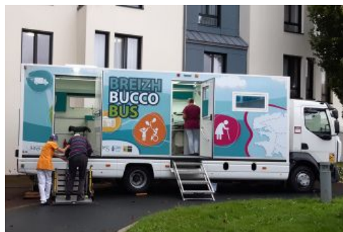
En savoir plus sur le Breizh Bucco Bus

EHPAD, IME, FAM, MAS, vous souhaitez mettre en place ce type de dispositif au bénéfice de vos résidents ? Faites appel à LaMAREC pour vous accompagner dans la réflexion !